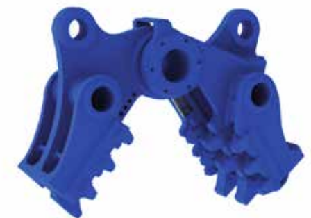
CP KIT FRAGMENTADORA