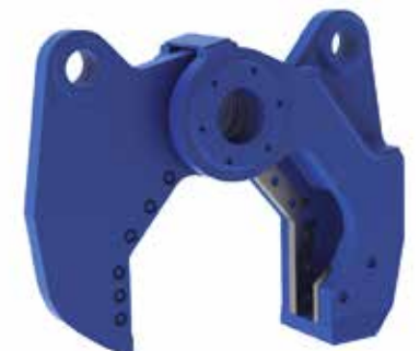
SH KIT CIZALLA