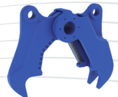
CC KIT COMBI CUTTER

Las características del producto y las especificaciones técnicas pueden variar sin obligación de previo aviso.