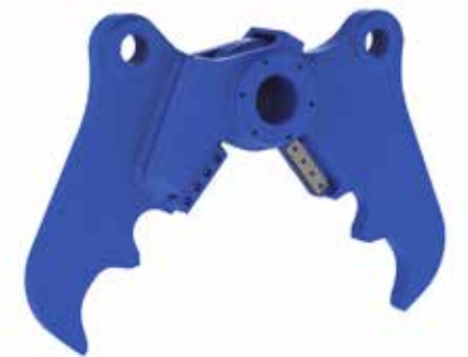
CR KIT PINZA

Válvula de Velocidad El elevado rendimiento de los cilindros está garantizado por la presencia de la válvula de velocidad. En caso de excavadoras con grandes capacidades, no es necesario utilizar esta aplicación.